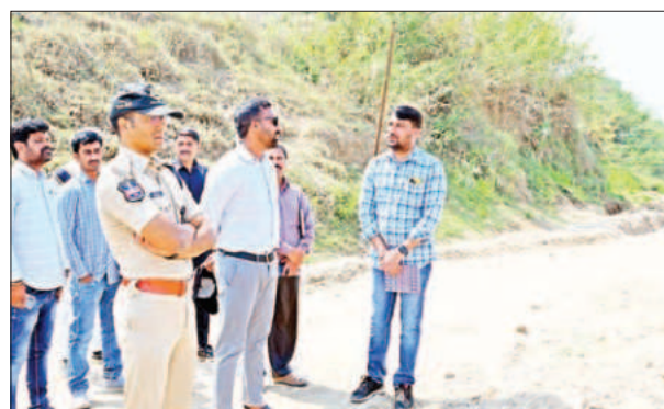
ఒకవేళ ఇసుక అక్రమంగా తరలిస్తున్నట్లు అమ్ముతున్నట్లు దొరికిన వారిపై

ఇసుక దొంగతనం తో పాటు పలు కేసులు నమోదు చేయనున్నారు. ప్రభుత్వం ఇసుక అక్రమ రవాణా అమ్ముకాలపై సీరియస్ గా ఉండడంతో జిల్లాలో ఎక్కడ ఇసుక అక్రమ రవాణా జరగవద్దని క్రయవిక్రయాల జరగవద్దని దొరికినవారుపై ఇసుక దొంగతనం కేసులు నమోదు చేయాలని జిల్లా కలెక్టర్ సత్యప్రసాద్ అధికారులకు ఆదేశాలు జారీ చేశారు. జిల్లాలో ప్రభుత్వపరంగా ఇసుక అమ్ముకాలు జిల్లా కలెక్టర్ సత్యప్రసాద్ అధ్యక్షతన సమావేశం ఏర్పాటు చేసి