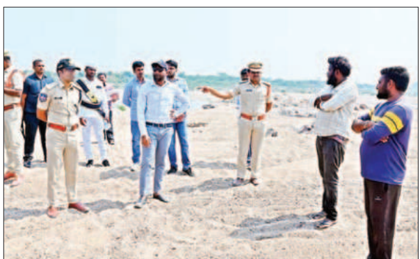
మొదటి పేజీ తరువాయి..

జగిత్యాల జిల్లాలో గత కొంతకాలంగా గోదావరి నది పరివాహ ప్రాంతం ఇటహింపట్నం మల్లాపూర్ రాయికల్ ధర్మపురి రాయపట్నం వెల్గుటూర్ తదితర ప్రాంతాలలో ఇసుక అక్రమ రవాణా చేసి ఇసుక రీమలలో డంపింగ్ చేసిన అనంతరం దొంగతనాన అమ్ముకాలు జరుపుతుంటారు. జిల్లాలో ఇసుక అక్రమ రవాణా, అమ్ముకాలు ఎక్కువగా జరుగుతున్నట్లు ప్రజా ప్రతినిధులకు తెలియడంతో అక్రమ రవాణాను ఆరికట్టాలని సీఎం రేవంత్ రెడ్డి కలెక్టర్ ను ఆదేశించినట్లు సమాచారం.